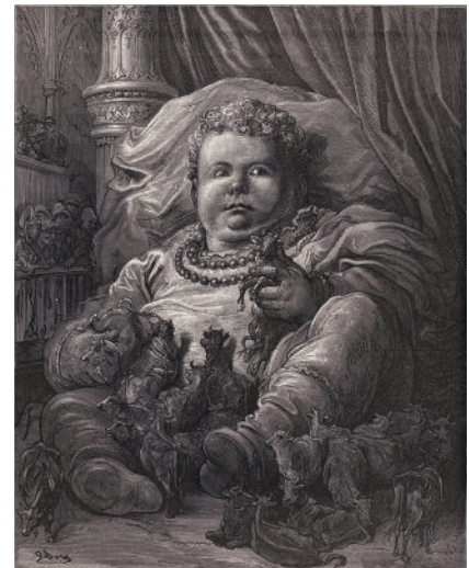
Gustave Doré (1832-1883) Je laisse icy à dire comment..., il humoit le laict de quatre mille six cens vaches... Cat. 30, Liv. II, Ch.IV - La vie très horrifique du grand Gargantua père de Pantagruel, T 1, 1873, gravure sur bois