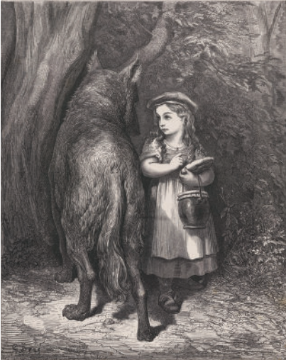
Gustave Doré (1832-1883) Stéphane Pannemaker (1847-1930) En passant dans un bois... p.1 pour Le petit chaperon rouge - Les contes de Perrault, 1867, gravure sur bois