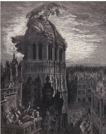
Gustave Doré (1832-1883) Je croy que ces marroufles veulent que je leur paye icy ma bien venuee je leur vais donner le vin Cat. 9, Liv. 1°, Ch.XVI - La vie très horrifique du grand Gargantua père de Pantagruel , T 1, 1873, gravure sur bois Coll. Musée de Gravelines