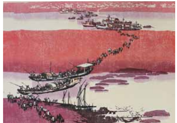
Pimo Huang La traversée du fleuve en automne gravure sur bois en couleurs, 1985 50 x 65 cm - Coll. Musée de Gravelines