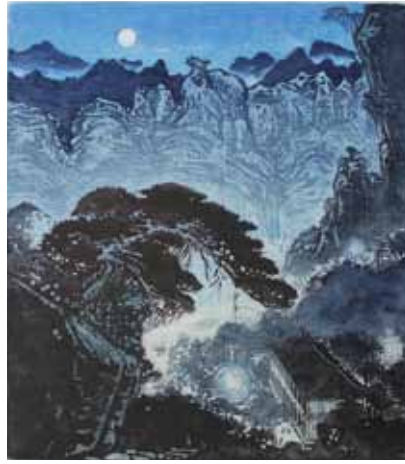
Zhiguang Liu La nuit au clair de lune, à Yandang gravure sur bois en couleurs, XX e 50 x 65 cm - Coll. Musée de Gravelines