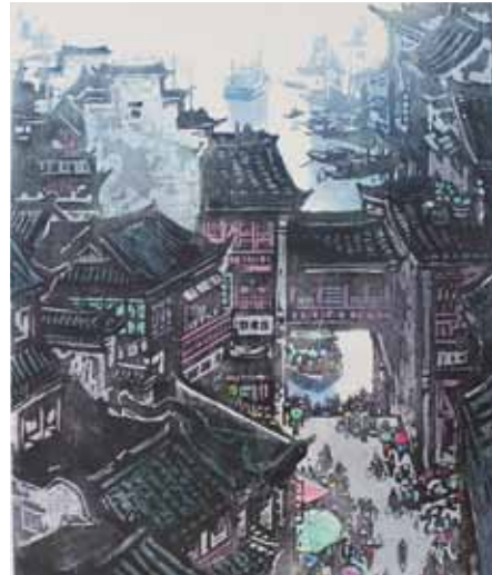
Zhixin Cai Embarcadère près du fleuve Qingyi gravure sur bois en couleurs, 1985 Coll. Musée de Gravelines