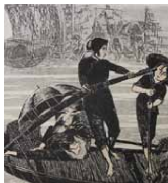
Chun Jiang La pluie à Hui gravure sur bois en couleurs 1982, 60 x 80 cm Coll. Musée de Gravelines