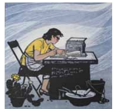
Mian Wang La belle époque gravure sur bois en couleurs 1984, 50 x 50 cm Coll. Musée de Gravelines