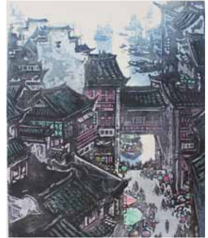
Zhixin Cai Embarcadère près du fleuve Qingyi gravure sur bois en couleurs, 1985 50 x 65 cm - Coll. Musée de Gravelines